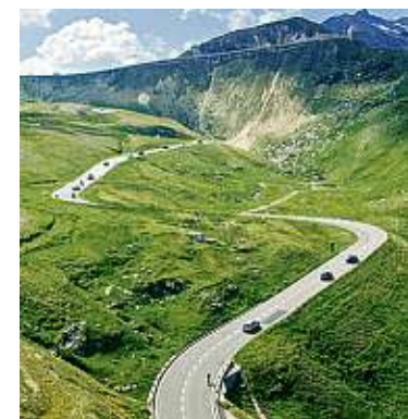
Stimmungsvolles Panorama: die Glockner-Hochalpenstraße, von der Salzburger Seite