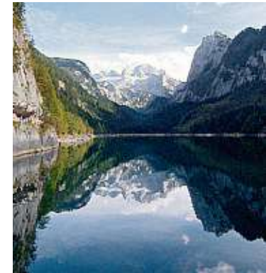
Österreichs schönste Berge, Täler und Seen, gefilmt von oben: hier der Gosausee, Oberösterreich