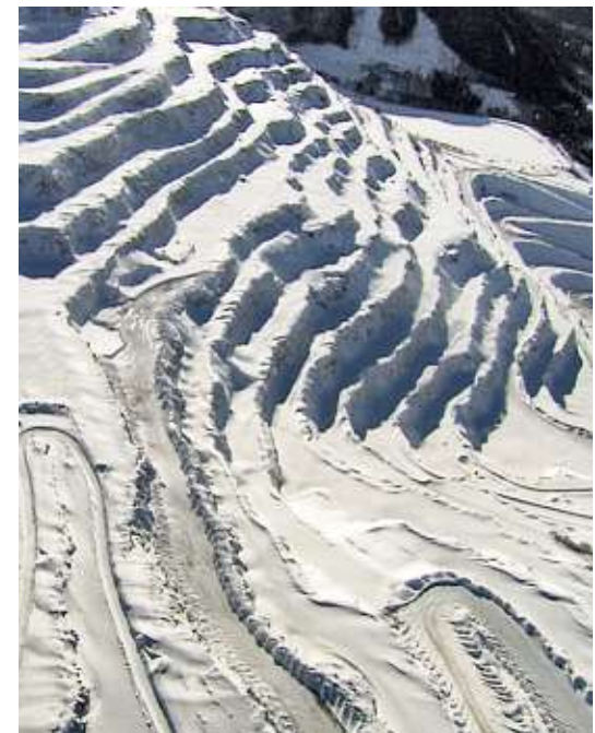
Abstrakter Winterzauber: der steirische Erzberg