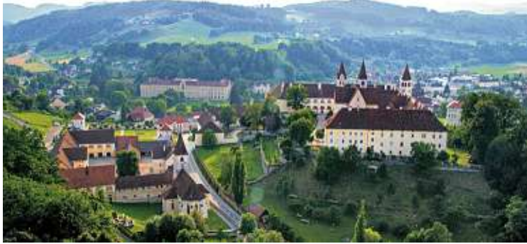
Faszinierende Blicke auf das Land: Benediktinerstift St. Paul im Lavanttal

ÜBER ÖSTERREICH: MONTAG, ORF III, 20.15 UHR